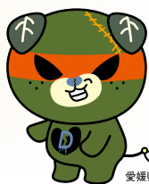
愛媛県「ダークみきゃん」

URL https://www.pref.ehime.jp/h14300/kandomonogatari.html