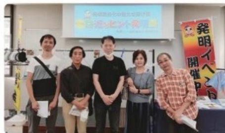
一瞬だけマスクを外し、呼吸を止めて撮影！