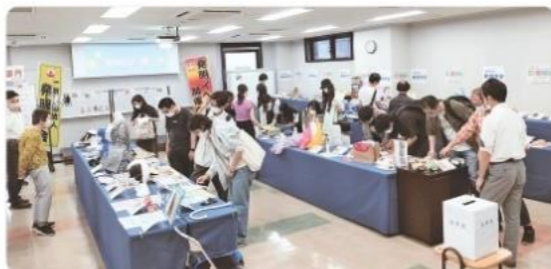
コロナ禍にもかかわらず、熱意が伝わってきます！