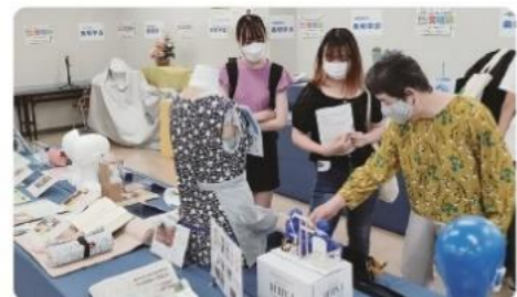
学生も発明品に興味津々

当日は感染症対策として換気を徹底いたしました。また、参加者の皆様にも手指の消毒や検温にもご協力いただき、無事展示会を終了することができました。応募いただいた発明者の皆様、ご来場いただいた方々、協賛企業やマスコミ関係者等、ご参集いただいたすべての皆様に心からお礼申し上げます。