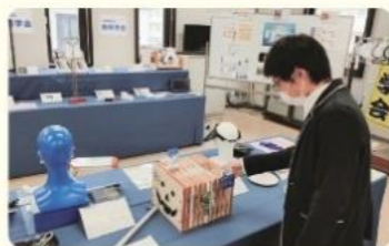
発明品をチェックする協賛企業の担当者様

今後事務局は積極的に働きかけ、1件でも多くの発明品が商品化されるよう、全力で応援してまいります。